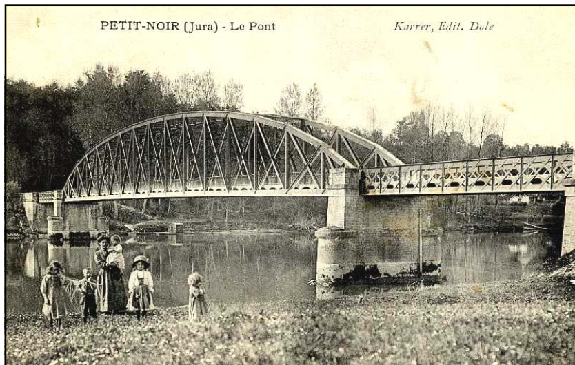
PETIT-NOIR (Jura) - Le Pont